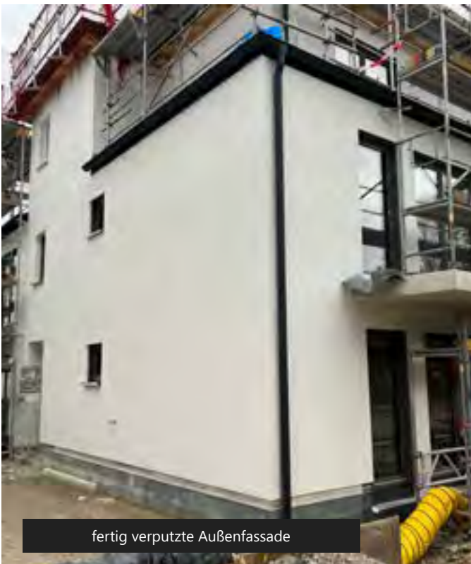
fertig verputzte Außenfassade

Wall next to the kitchen unit: The electrical appliances provided for in the kitchen planning, e.g. cooker, refrigerator, etc., have a standard manufacturer's dimension. Since the unfinished dimension usually differs from the finished dimension, a free wall area without a side wall can be used much more flexibly in practice. In order to be able to accommodate all the desired appliances, we have dispensed with this wall.