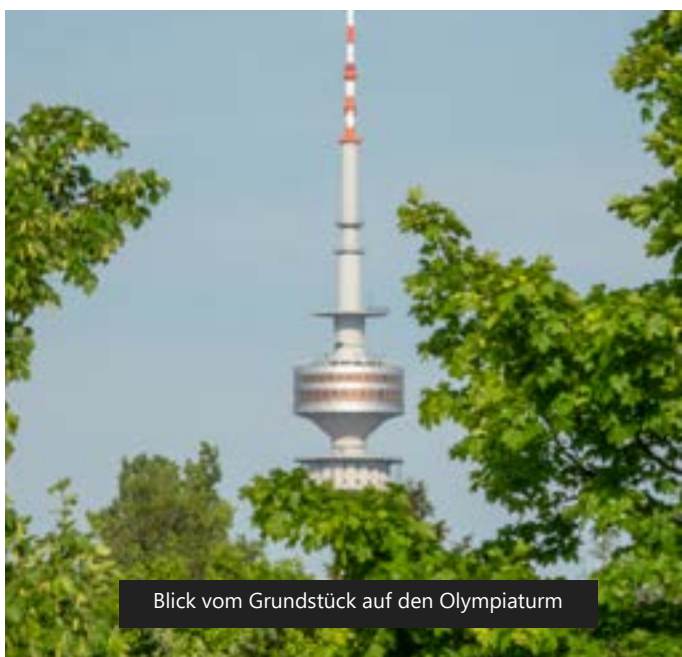
Blick vom Grundstück auf den Olympiaturm