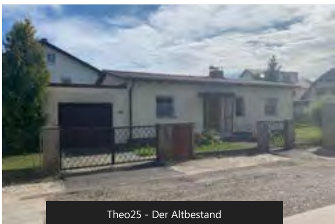
Theo25 - Der Altbestand

The Theo25 plot is located near our Herbig project, at 25 Theodor-Fischer-Strasse. A large and modern school has been built only a few hundred metres next to it. The plot is completely quiet within a very nice residential area