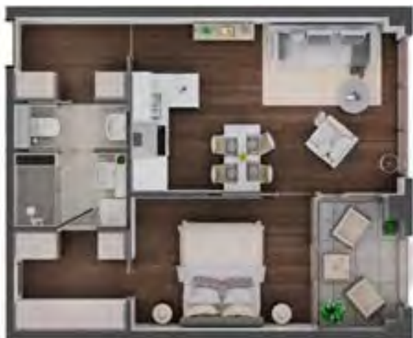
neuer Grundriss, 40-45 qm Wohnung

Special highlight: With Bodenschneid1, we are introducing a new type of floor plan. In addition to the 30 sqm studio flats, we will also offer larger 40-45 sqm flats in the future that are ideal for both investors and owner-occupiers. This type of flat is ideal for two residents or small families. Thanks to an optimised floor plan from our partner JLL, we can thus offer the comfort of 50-60 sqm flats.