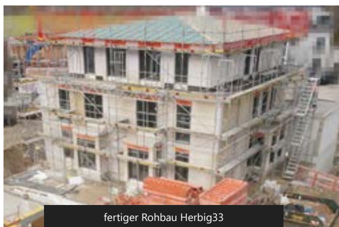
fertiger Rohbau Herbig33