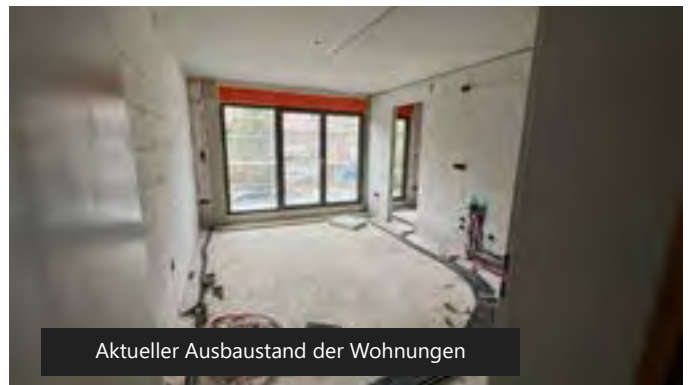
Aktueller Ausbaustand der Wohnungen