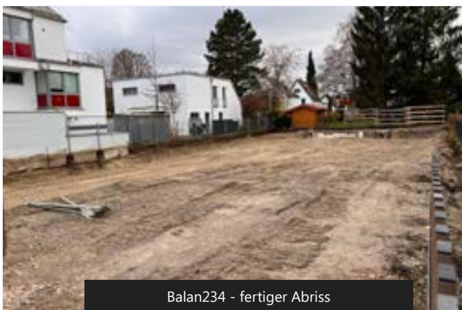
Balan234 - fertiger Abriss